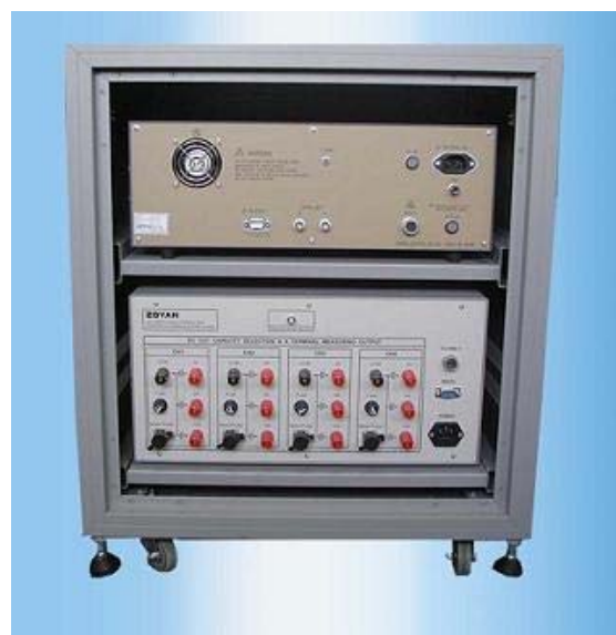
系统组合硬件后面板

杭州总研电气有限公司 HANGZHOU SOKEN ELECTRIC CO., LTD.