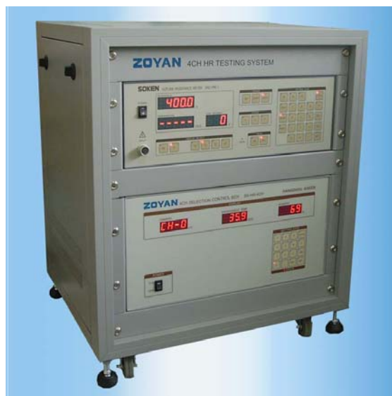
系统组合硬件前面板

***The manufacturer reserves the right to change the specifications without prior notice***